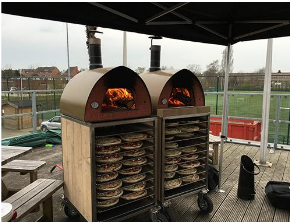
12 soorten pizza's bereid in authentieke mobiele Italiaanse houtovens